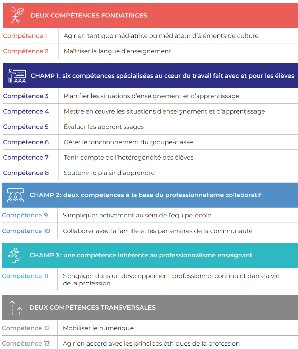
Tableau 1: Synthèse des 13 compétences professionnelles du personnel enseignant

Ministère de l'Éducation du Québec. (2020). Référentiel de compétences professionnelles : Profession enseignante . Gouvernement du Québec, p.43.