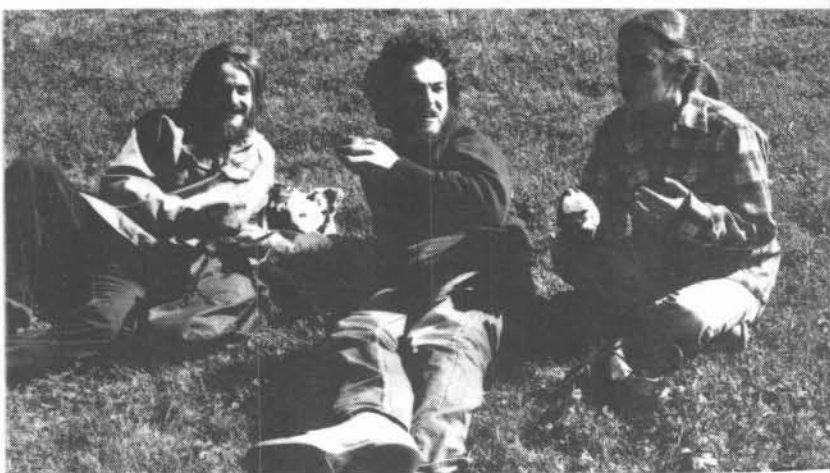
Une petite partie de cartes, epi apres?... Vive le plein air et les pommes.