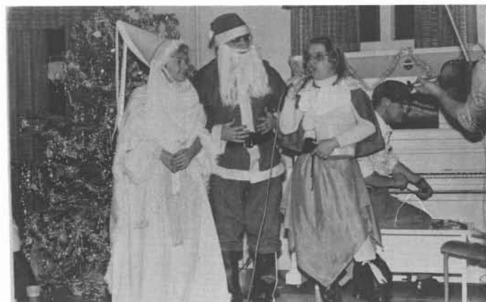
Lors du party de Noël des étudiants en décembre dernier, le Père Noël avait amené toute son équipe pour créer une ambiance de réjouissance.