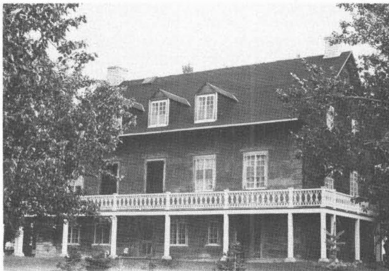
Un bien du patrimoine régional: la maison seigneuriale de la famille Bertrand-Michaud, construite en 1854, à l'Isle-Verte.

Les professeurs-es en histoire souhaitent que ce programme soit offert dès janvier 1989, et ont entrepris des démarches dans ce