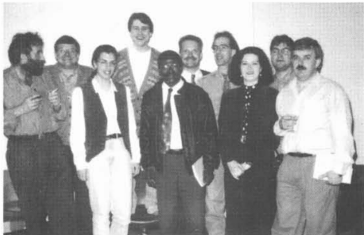
Le groupe d'auteurs présents au lancement.

L e 7 avril dernier a eu lieu le lancement de l'ouvrage collectif intitulé Le vertige de la liberté : essais sur la Pologne postcommuniste , publié par le GRIDEQ dans la collection «Actes et instruments de la recherche en développement régional».