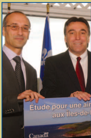
Le CERMIM au cœur d'une importante étude p.3