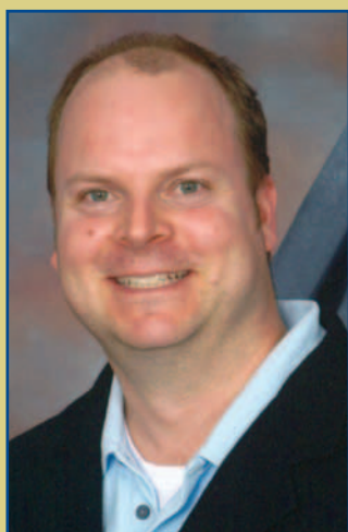
Une recherche qui donne la parole aux jeunes p.5