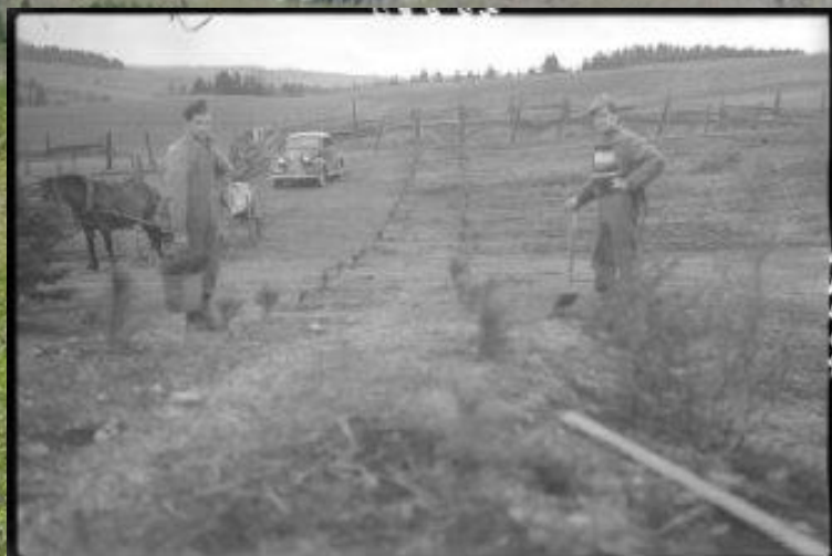
Reboisement à Vallée-Jonction, comté de Beauce / Alp. Guimont – 1945, COTE : E6,S7,SS1,P25888, Centre d'archives de Québec, BANQ.