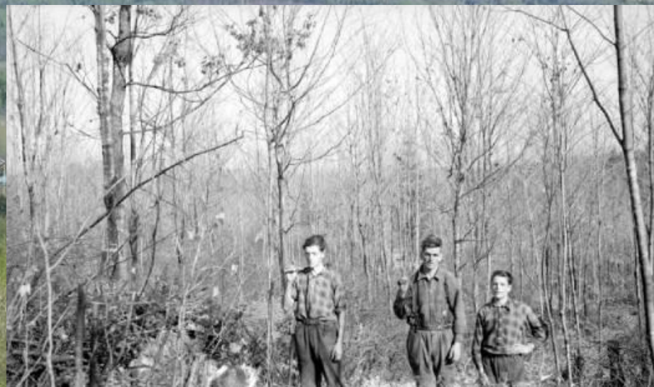
Trois hommes dans une forêt / Armand Fafard – 1948, E6,S7,SS1,P67224, Centre d'archives de Québec, BANQ