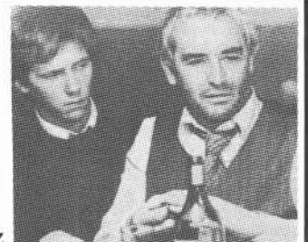
LE DERNIER NABAB