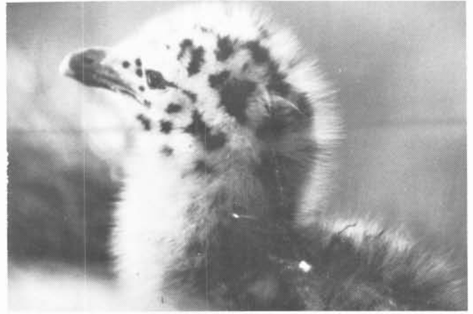
Jeune Goéland argenté, Île Canuel, Bic

Munis de bouquins d'ornithologie, d'appareils d'observation (jumelles, télescope X25) et d'appareils photos (Zoom 75 à 200 et téléobjectif 300), nos camarades ont donc parcouru les