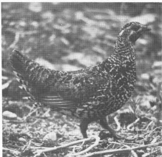
Une future résidente de l'île d'Anticosti?

Le tétras est un oiseau qui autrefois se retrouvait dans tout le Québec. Peu farouche, il est présent aujourd'hui en moins grand nombre qu'avant dans les régions peu-