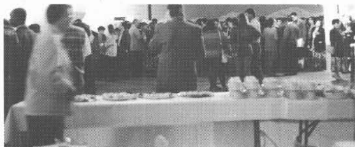
Un buffet fort apprécié a suivi la cérémonie d'ouverture.