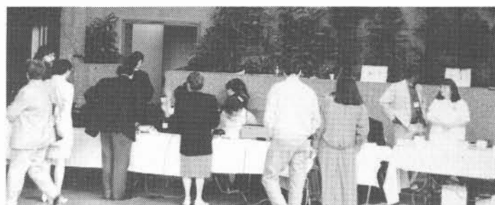
Le personnel de l'Acfas et de l'UQAR accueillait les congressistes, aux tables d'inscription installées à l'Atrium.