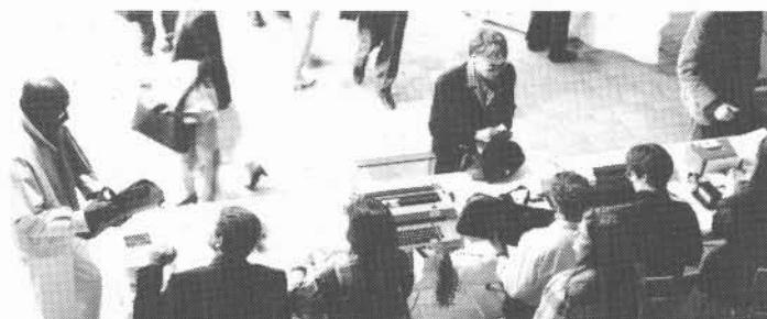
Dès lundi, on était à pied d'oeuvre, aux tables d'inscription.