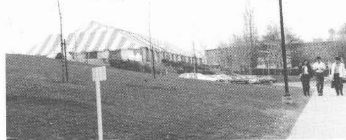
Contre vents et marées, un grand chapiteau a été monté dans le stationnement ouest de l'UQAR. Chaque soir, un 5 à 7 y réunissait les congressistes.