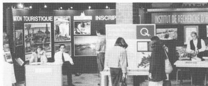
L'Office du tourisme et des congrès de Rimouski et Hydro-Québec étaient à l'Atrium de l'UQAR, pendant toute la durée du Congrès.