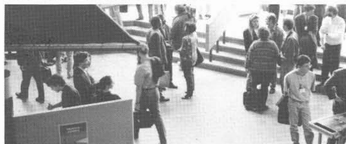
L'Atrium de l'UQAR s'animaît : du mouvement, des conversations... et le soleil au rendez-vous.