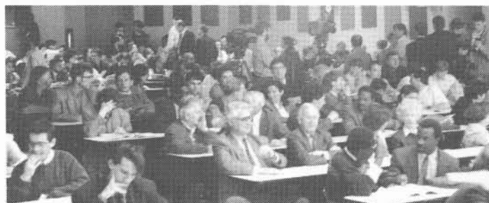
Congressistes, journalistes et caméras avaient envahi l'amphithéâtre pour la cérémonie d'ouverture.

Le 61 e congrès de l'Acfas, qui a réuni en nos murs quelque 3 000 chercheuses et chercheurs, et qui a mobilisé les énergies de plus de 200 personnes de la communauté universitaire a pris fin vendredi dernier. L'UQAR-INFO a pensé vous présenter, à titre de souvenir (déjà!) quelques photos.