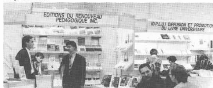
À la palestra, un «salon du livre» offrait aux congressistes les parutions scientifiques les plus récentes.