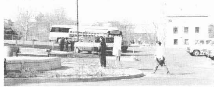
Un service de navettes spéciales permettait des déplacements entre les sites du congrès. Le stationnement avant de l'UQAR était leur port d'attache.