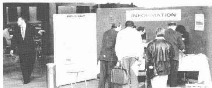
À l'UQAR, comme sur chacun des sites du congrès, un kiosque d'information.