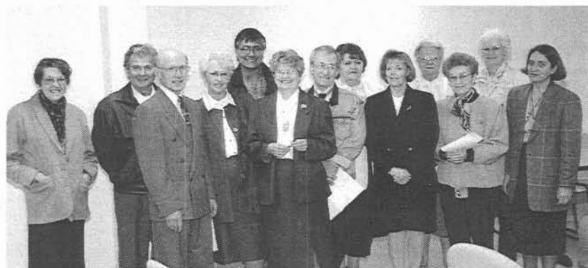
Quelques-unes des personnes qui ont suivi des activités de formation

Au cours de l'année 1995-1996, 75 personnes ont suivi des activités de formation régulières qui sont offertes par l'Association, allant de l'anglais à l'espagnol en passant par le tai-chi et l'initiation informatique. L'Association a également présenté une initiation au phénomène Internet, une activité très populaire avec 70 participants.